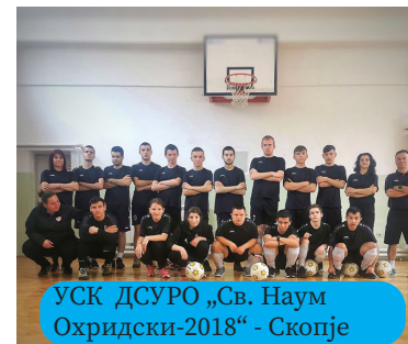
УСК ДСУРО „Св. Наум Охридски-2018“ - Скопје

Проекти Еко училиште, Меѓуетничка интеграција во образованието, Проект на ФФМ „Фудбал за сите способности - Државно средно училиште за рехабилитација и образование Св. Наум Охридски“ поддржан од УЕФА, Еразмус + проекти: Let's get G.R.E.E.N и All Inclusive - Overcoming Barriers to Participation