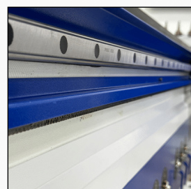
ДВИЖЕЊЕ НА X И Y ОСКА

Движењето на оските е преку линеарни водилки (30mm и 25mm) и назабена летва, од високо реномираниот бренд HIWIN од Тајван, докажано најдобар и најупотреблив систем на движење кај повеќето цнц машини. Овозможува непопречена работа, ниска бучава и значително намалување на сите дополнителни оптоварувања.