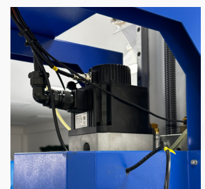
СЕРВО МОТОРИ СО ВИСОКА ПРЕЦИЗНОСТ

Движењето на оските е преку линеарни водилки (30mm и 25mm) и назабена летва, од високо реномираниот бренд HIWIN од Тајван, докажано најдобар и најупотреблив систем на движење кај повеќето цнц машини. Овозможува непопречена работа, ниска бучава и значително намалување на сите дополнителни оптоварувања.