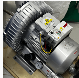
ИНДУСТРИСКА ВАКУУМ ПУМПА

Z оската се смета за најоптоварена и поради тоа е имплементирано навојно вретено кое овозможува исклучително прецизност, ниско триење на елементите, максимално штитење од брзо абеење како и превентива од загревање на елементите кој се тријат за време на работа на машината.