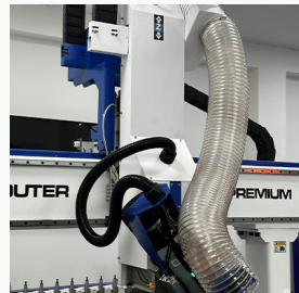
ДВИЖЕЊЕ НА Z ОСКА

Работната маса на машината е конструирана од специјална пластика отпорна на абеење и за користење на вакуум пумпа. Дополнително има интегрирани "Т" алуминиумски шини кој овозможуваат мануелно фиксирање на парчето со помош на стеги.