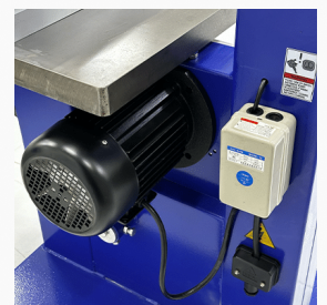
ЕКОНОМИЧЕН И МОЌЕН МОТОР

Масивни тркала со 500mm дијаметар и 35mm ширина, на кој е поставена пила со димензии 4020x16mm.